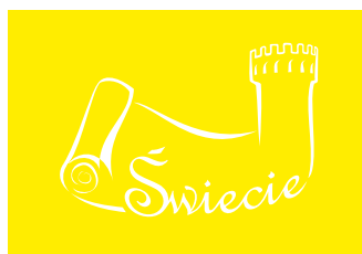
za jasne tło