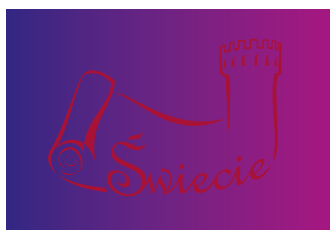
za ciemne tło